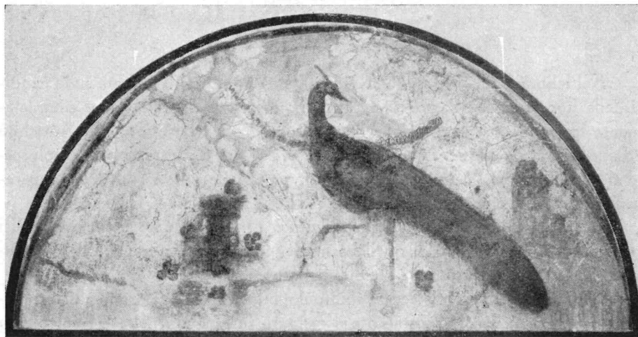
FIG. 1. - ROMA - MUSEO DELLA VIA OSTIENSE - ARCOSOLIO CON PAVONE.

I due quadri col loro fondo bianco, con le figure tracciate in tinte tenui e smorte, con le leggere architetture evanescenti e quasi sperdute in un'atmosfera