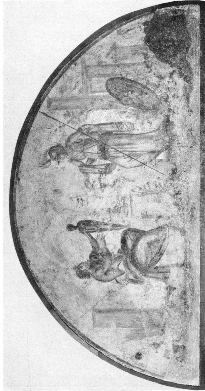
ROMA - MUSEO DELLA VIA OSTIENSE - ARCOSOLIO CON PROMETEO E ATENA