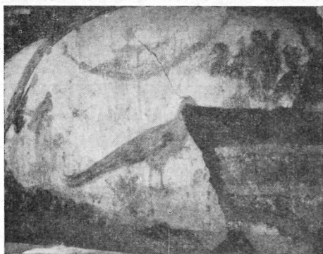
FIG. 3. - UNA DELLE LUNETTE DEL COLOMBARIO PRIMA DEL DISTACCO.

menti romani compare con certezza la scena della creazione, per lo più formulata secondo uno schema fisso, e quando soltanto una parte del gruppo originario (Prometeo e la sua creazione) viene utilizzata, nella composizione essa è pur sempre legata al prototipo da identità di atteggiamento e di disposizione. Se la presenza del mito in sarcofagi e in pitture di tombe è pienamente giustificata per il simbolismo in esso racchiuso, meno chiara o almeno meno giustificabile appare la sua apparizione su un medaglione. Ma forse proprio questo piccolo monumento di tipo evidentemente non funerario può essere una prova o del favore che ad un certo momento ebbe presso i Romani un gruppo scultoreo o una pittura (il Robert