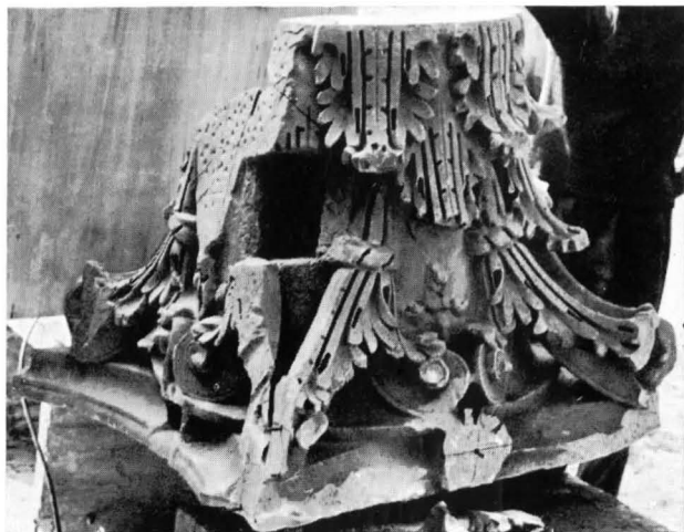
FIG. 21 - SINAGOGA, UNO DEI CAPITELLI DELLE COLONNE MAGGIORI; BEN VISIBILI GLI INCASSI ANTICHI PER PARTI RIPORTATE

7) Cfr. C. H. KRAELING, The Synagogue (Excavations at Dura Europos, Final Reports, VIII, 1), New Haven, 1956.