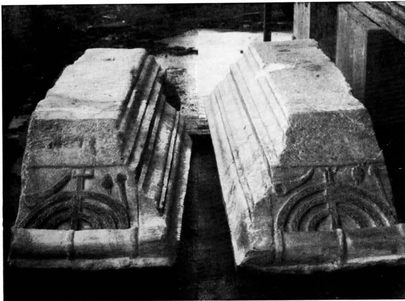
FIG. 16 - OSTIA, SINAGOGA - ARCHITRAVI-MENSOLE DELL'EDICOLA DELLA TORAH

Manca inoltre, almeno per ora (dato che resta in sospeso il problema della collocazione delle colonne minori di cui si è detto) una sicura tripartizione in navate dell'aula; comunque potremmo al massimo avere una disposizione simile a quella delle sinagoghe più tarde tipo "basilica cristiana", ma è da escludere la sistemazione di tipo basilica ellenistico-romana con colonne su tre lati della