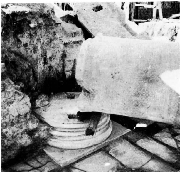
FIG. 10 - BASE DELLA COLONNA DELLA SINAGOGA INGLOBATA NELLA MURATURA DELL'EDICOLA DELLA TORAH