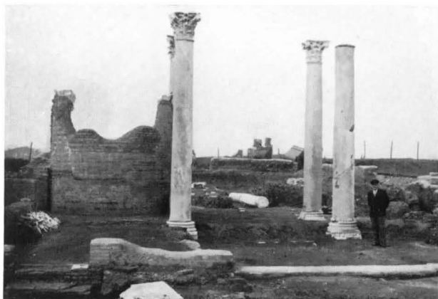
FIG. 7 - SINAGOGA, LE COLONNE MAGGIORI E L'ABSIDE DELL'EDICOLA DELLA TORAH, DOPO IL RESTAURO