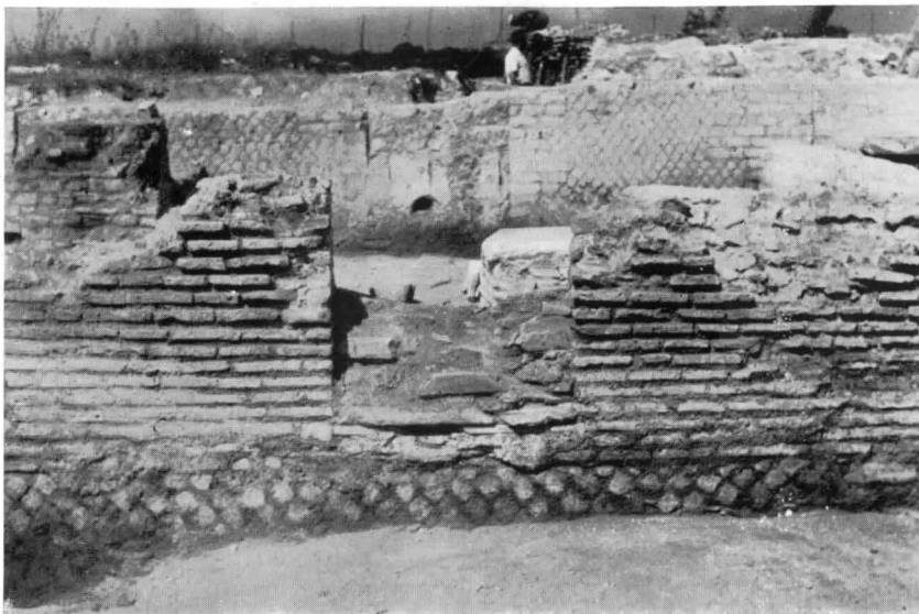
FIG. 17 - SINAGOGA, PORTA RICHIUSA DELL'AMBIENTE CON FORNO: VEDUTA ESTERNA

Come orientamento abbiamo già visto che la sinagoga di Ostia segue il