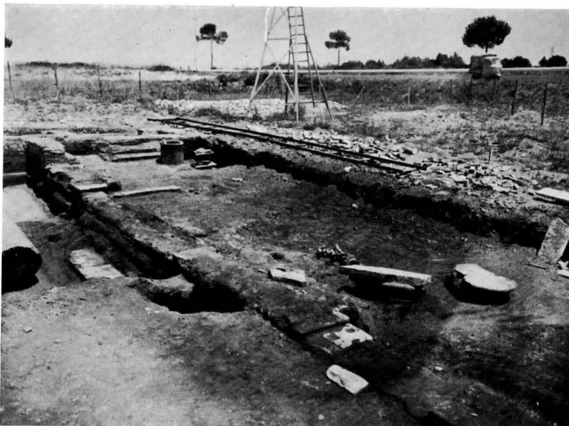
FIG. 5 - IL NARTECE (O ATRIO?) DELLA SINAGOGA ALLO STADIO ATTUALE DEGLI SCAVI

appare sommariamente lavorato a gradina e presenta a m. 0,67 dalla fronte un profondo incasso rettangolare (m. 0,27 × 0,16 × 0,12), alloggiamento per un trave ligneo o per altro elemento trasversale destinato sia ad incatenare i due architravi sia a sorreggere il probabile frontoncino, che doveva coronare la costruzione (fig. 15), mascherando la parte superiore dell'abside. 9 )