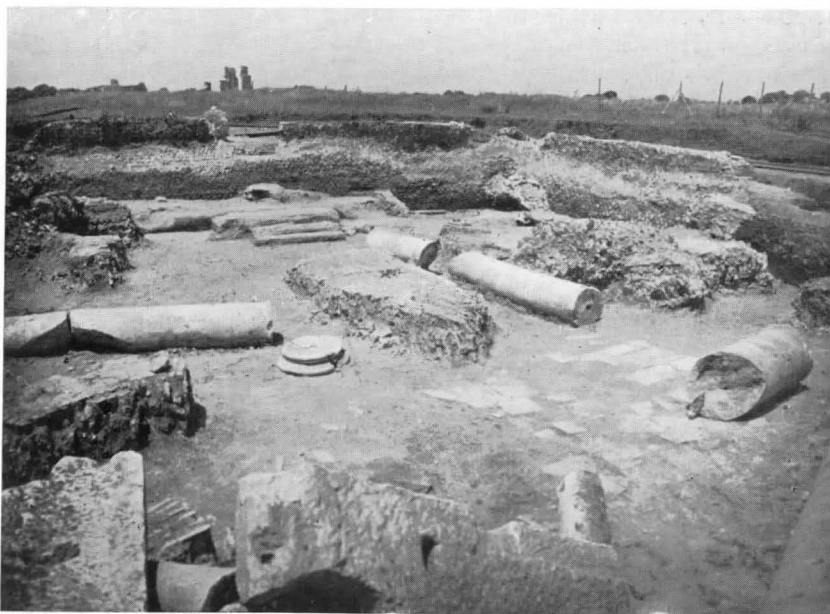
FIG. 9 - PARTE PIÙ INTERNA DELLA SINAGOGA CON LE COLONNE MINORI E LA PARETE DESTRA ANCORA AL SUOLO (Fot. Sopr. Ant. Ostia)

in rozzo battuto misto di terra, calce e cocci frammentati, poggia direttamente su un sottostante pavimento a mosaico bianco e nero con motivi geometrici, che si è individuato in varie zone ove è stato asportato il battuto (fig. 20). L'impossibilità di procedere all'immediato distacco e consolidamento del mosaico (come gli altri rinvenuti nell'aula della sinagoga, poco coerente) ha consigliato di lasciarlo ancora coperto dalla provvidenziale coltre costituita dal battuto soprastante: non possiamo quindi dire se esso sia stato rotto dalla costruzione del forno, della spianatoia e del muro divisorio, o se sia sorto in relazione con essi e solo più tardi coperto dal rozzo battuto; parimenti non sappiamo se sia per tutta la sua estensione decorato con motivi geometrici o se vi compaiano anche altre figurazioni. La ripresa degli scavi e il loro completamento potrà chiarire questi interrogativi; io non posso che augurarmi che, come in altre sinagoghe