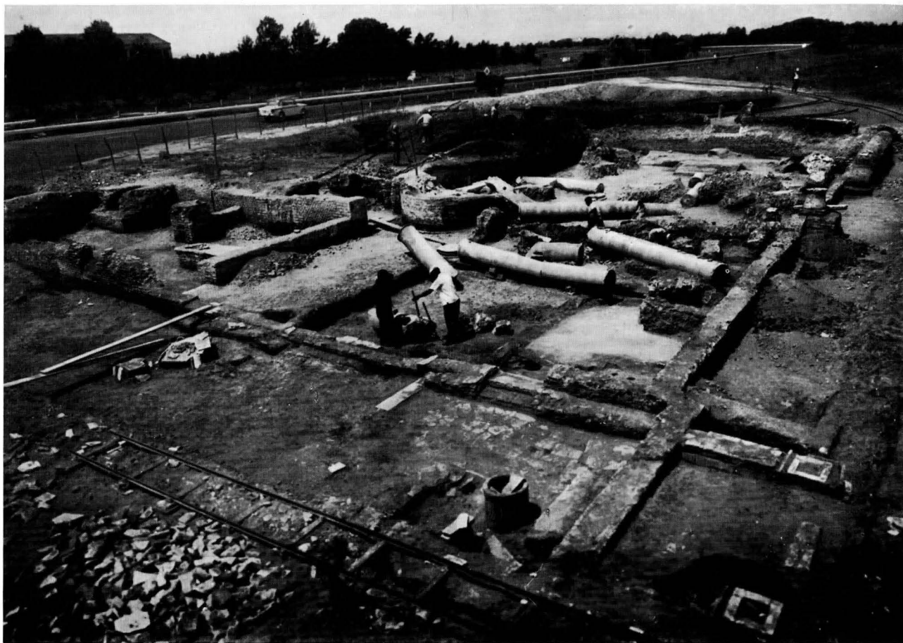
FIG. 3 - SINAGOGA, VEDUTA GENERALE DA SUD-EST, PRIMA DEL RESTAURO

già ricordate: sebbene tutto faccia supporre che anche queste dovessero trovar luogo nell'aula, per ora non è stato possibile ricollocarle anche perchè non si sono trovate le basi in posto, nè è stato possibile studiare tutta l'area del pavimento di questa parte della sinagoga, ingombra com'è della parete destra abbattuta (fig. 9). 5)