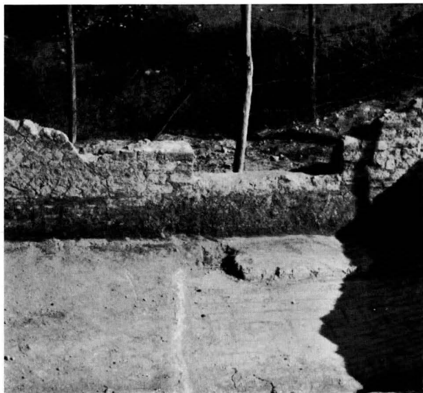
FIG. 20 - SINAGOGA, IL PAVIMENTO BATTUTO SOVRASTANTE QUELLO A MOSAICO NELL'AMBIENTE DEL FORNO

Sembra dunque che la sinagoga di Ostia risponda a tutte le principali caratteristiche di orientamento, di situazione topografica e di elementi caratteristici degli edifici congeneri e la presenza di ambienti annessi, per ora non scavati, non fa che confermare, potremmo dire, l'ossequenza alle prescrizioni scritte o ingenerate dall'uso e