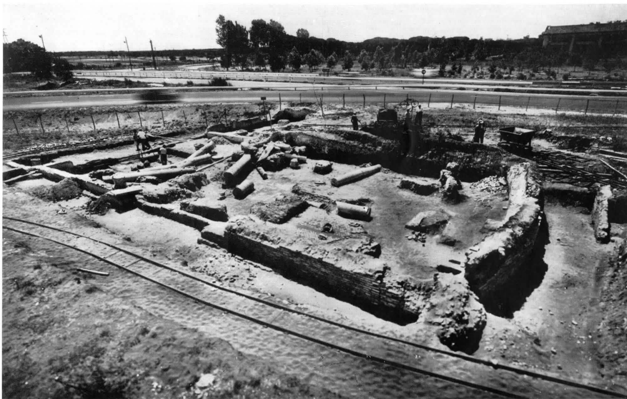
FIG. 4 - VEDUTA GENERALE DELLA SINAGOGA, DA NORD

In quella che per ora chiameremo convenzionalmente 'navata sinistra' sorge l'edicola ove doveva essere conservata l'arca della legge. Costruita tutta in opus vittatum essa si presenta come un'edicola con alto podio e abside orientata verso sud-est, cioè verso la fronte dell'edificio e quindi verso Gerusalemme (fig. 12). Essa occupa la navata in tutta la sua larghezza e si addossa alla seconda delle colonne di sinistra inglobandone parte del fusto e della base (fig. 10). Dinanzi ai piloni dell'abside erano due colonnine (alte m. 2,70; sommo scapo diam. 0,32; imo scapo 0,37) con basi pure di marmo (alt. m. 0,185; diam. sup. 0,43) e capitelli compositi. 6)