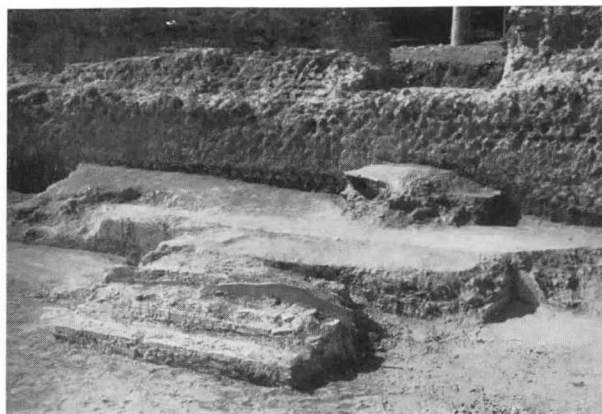
FIG. 8 - IL PODIO ADDOSSATO ALLA PARETE DI FONDO DELLA SINAGOGA

rozzo conglomerato, che fan pensare che il narcece desse verso altri ambienti o forse verso un atrio antistante la sinagoga: da questa zona provengono due belle basi marmoree di colonne con tori finemente decorati di corona di quercia e treccia e con gola strigliata. Purtroppo sono state rinvenute in superficie e fuori posto e quindi per ora non sappiamo se facessero parte della sinagoga o se si tratti di materiale di spoglio di qualche edificio finitimo.