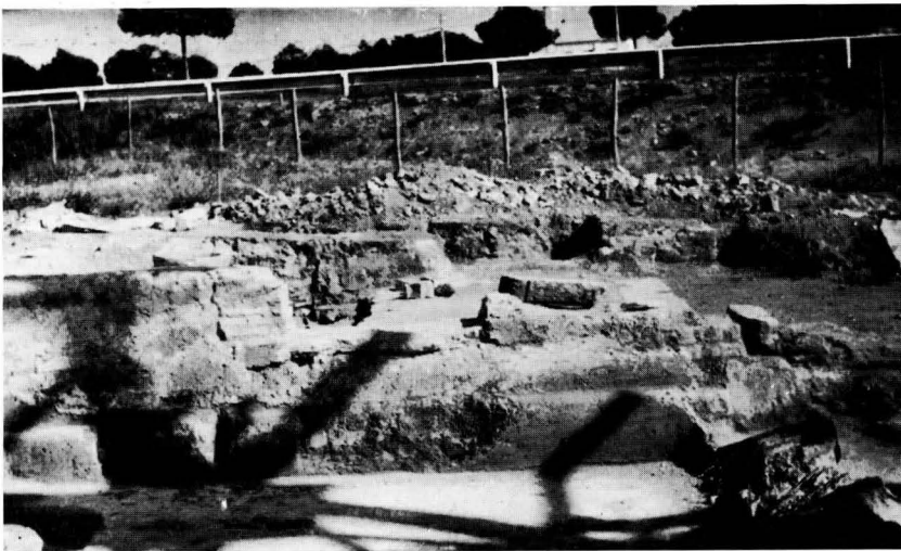
FIG. 6 - BACINO ALL'INTERNO DELLA SINAGOGA PRESSO L'INGRESSO DI DESTRA

Doveva aggiungere nobiltà all'insieme la doratura degli oggetti decoranti le mensole terminali, doratura attestata