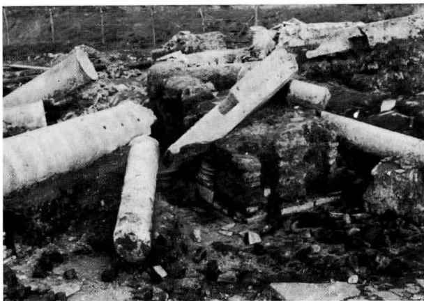
FIG. 12 - SINAGOGA, L'EDICOLA DELLA TORAH AL MOMENTO DEL RINVENIMENTO

Uniche tracce superstiti di una sua possibile esistenza erano un'iscrizione funeraria rinvenuta a Castel Porziano 11)