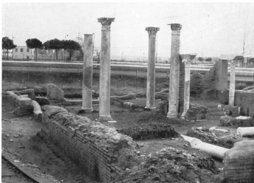
FIG. 14 - SINAGOGA, L'EDICOLA DELLA TORAH E LE COLONNE MAGGIORI DELL'AULA DOPO IL RESTAURO (VEDUTA DA NORD) (Fot. Sopr. Ant. Ostia)

lato breve orientato verso Gerusalemme, si collega indubbiamente alle sinagoghe del tipo Galileo, ma non ha, come quelle, un tramezzo architettonico contro la parete frontale