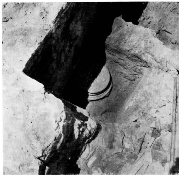
FIG. 11 - BASE DELLA COLONNINA DI DESTRA DELL'EDICOLA DELLA TORAH, NASCOSTA DALL'AMPLIAMENTO DEL PODIO

note, si rinvenga qualche iscrizione commemorante la pietà dei fedeli che a loro spese fecero decorare con pavimenti musivi il luogo di culto.