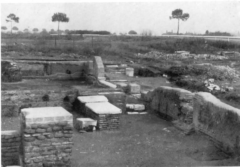
FIG. 18 - SINAGOGA, LA SPIANATOIA NELL'AMBIENTE ANNESSO

È stato rilevato che non esistono nei testi speciali prescrizioni in proposito, anzi l'unica nota nel Talmud dice che la sinagoga doveva essere costruita nella parte più alta della città. 23) Evidentemente tale ubicazione non era consigliabile nè possibile fuori della Palestina e vediamo quindi che la maggior parte delle sinagoghe note della Diaspora erano presso corsi d'acqua o vicino al mare