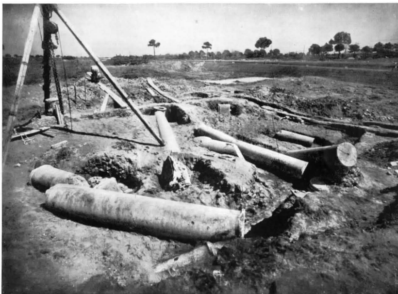
FIG. 2 - LE COLONNE DELLA SINAGOGA AFFIORANTI DOPO I PRIMI SAGGI DI SCAVO

Resta attualmente ancora da stabilire se l'edificio più antico avesse sin dai suoi inizi una destinazione sinagogale