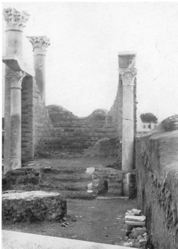
FIG. 13 - SINAGOGA, VEDUTA FRONTALE DELL'EDICOLA DELLA TORAH DOPO IL RESTAURO

Sia pure con qualche variante tutte le sinagoghe sino ad oggi note, sia della Palestina, sia della Diaspora, si riconducono a questi tipi fondamentali; la sinagoga di Ostia, costituita da un'aula rettangolare con fronte sul