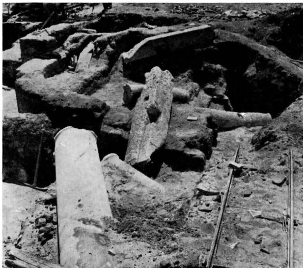
FIG. 15 - SINAGOGA, GLI ARCHITRAVI-MENSOLA ALL'ATTO DELLA SCOPERTA: SI NOTINO GLI INCASSI LUNGO IL FIANCO INTERNO

per racchiudere l'Arca delle Leggi, bensì un'edicola costruita a metà circa dell'aula, verso il suo fianco occidentale, edicola che, se può richiamare nel suo aspetto generale la nicchia della sinagoga di Dura Europos, non è come quella scavata nel muro, ma costruita liberamente come entità a se stante.