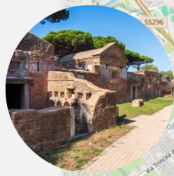
Necropoli di Porto