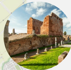
Scavi di Ostia